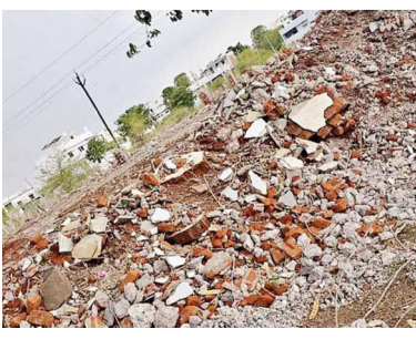
आहेत. सर्वात महत्त्वाचा प्रश्न म्हणजे,

नागरिकांच्या माहितीनुसार, अज्ञातानी रातोरात जेसीबीच्या सहाय्याने संपूर्ण इमारत पाडून टाकली. सध्या घटनास्थळी केवळ विटा आणि ढिगाऱ्याचे अवशेष शिल्लक आहेत. या संदर्भात भूमी अभिलेख विभागाच्या उपअधीक्षकांशी संपर्क साधला असता त्यांनी स्पष्ट माहिती देण्याचे टाळले. 'या प्रकरणाबाबत मला कोणतीही माहिती नाही,' असे सांगत त्यांनी हात झटकले. विभागाच्या या भूमिकेमुळे अनेक प्रश्न उपस्थित होत