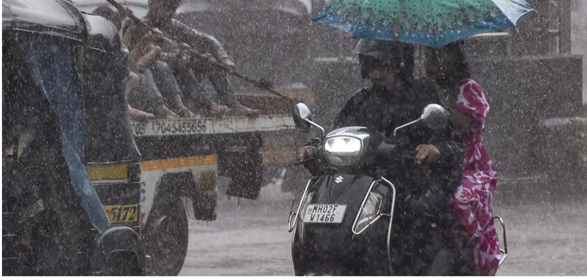
त्यामुळे बिहार, झारखंड, पश्चिम बंगाल, ओडिशा आणि छत्तीसगडच्या अनेक भागांत मेघगर्जनेसह हलका ते मध्यम

बिहार, झारखंड आणि पश्चिम बंगालचे हवामान पूर्व आणि मध्य भारतात मान्सून आणखी सक्रिय होण्याची शक्यता आहे.