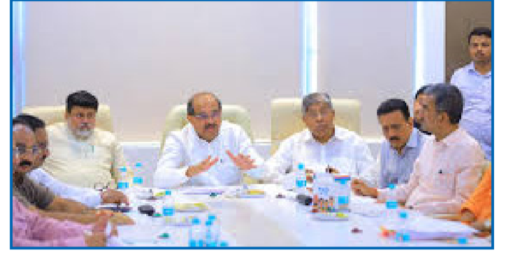
तसेच नवीन प्रकरणांना मंजुरी देताना होणारे दायित्व करण्याबाबतही चर्चा करण्यात आली विचारात घेऊन पुढील पाच वर्षांचा आराखडा तयार