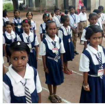
दरवाढीमुळे वाहतूक खर्चही वाढला आहे. याचा थेट परिणाम युनिफॉर्मच्या अंतिम किमतीवर झाला आहे.

*देगलूर प्रतिनिधी/संतोष चिद्रावर लोणीकर नवीन शैक्षणिक वर्षाला 15 जून पासून सुरुवात झाली असून शाळांच्या परिसरात विद्यार्थ्यांचा किलबिलाट पुन्हा ऐकू येऊ लागला आहे. मात्र शाळा सुरु होतात स्कूल युनिफॉर्मच्या वाढलेल्या किमतीमुळे पालकांची चिंता वाढली आहे. यंदा स्कूल युनिफॉर्मच्या दरात सरासरी दहा टक्के पर्यंत वाढ झाल्याचे विक्रेते व टेलर यांनी सांगितले आहे. कापडाच्या वाढत्या किमती, वाहतूक खर्चातील वाढ आणि शिलाई शुल्क महागल्यामुळे युनिफॉर्मचे दर वाढल्याचे व्यापाऱ्यांचे म्हणणे आहे. गेल्या वर्षात युनिफॉर्म तयार करण्यासाठी लागणाऱ्या कच्च्या मालाच्या किमती सातत्याने वाढल्या असून डिझेल