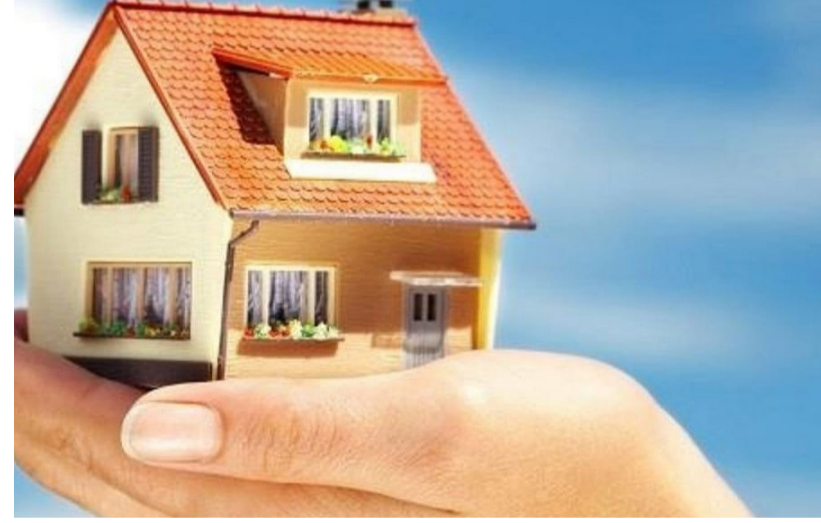
स्वप्न पुर्ण होत नसल्याने अडचणीचा सामना करावा लागणार आहे लाभार्थी ग्रामपंचायत व पंचायत समिती येथे चकरा मारून बेजार

औसा तालुक्यात प्रधानमंत्री व मोदी आवास घरकुल योजनेअंतर्गत हजारो घरकुलांचे उद्दिष्ट देण्यात आले होते तेवढ्याच घरकुलांना मंजुरी देण्यात आली होती त्यापैकी अनेक घरकुल पूर्ण होई झाली काही घरकुल अजूनही अपूर्ण आहेत मागील चार महिन्यांपासून तालुक्यात प्रधानमंत्री मोदी आवास योजनेस निधी मिळाल्या नसल्यामुळे ठणठणाट निर्माण झाला असल्याने परिणामी लाभार्थी अडचणीत सापडले आहेत प्रधानमंत्री आवास योजनेअंतर्गत चार टप्प्यात हा निधी प्रशासनाकडून वितरित केला जातो मात्र चार महिन्यांच्या पूर्वी काही लाभार्थ्यांना एक -दोन हप्ता मिळाला होता मात्र चार महिने उलटूनही काहीना दुसरा काहीना तिसरा हप्ता मिळत नसल्याने घरकुल लाभार्थी अडचणी सापडले आहेत लाभार्थ्यांनी आपली घरी राहते घरे घरकुलासाठी तोडल्याने ऐन पावसाळ्यामध्ये परिवारास निसर्गाच्या पावसाळ्यापुर्वी घरकुल घरात राहण्याचे