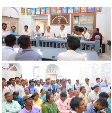
जाहीर केलेली नसल्याने स्थानिक ग्रामस्थांमध्ये चिंतेचे वातावरण आहे. या पार्श्वभूमीवर प्रकल्पग्रस्त ग्रामस्थांच्या मागण्या, कायदेशीर हक्क, भूसंपादन प्रक्रिया, पुनर्वसन आणि भविष्यातील परिणाम यांचा सविस्तर आढावा घेण्यासाठी या बैठकीचे आयोजन करण्यात आले होते.