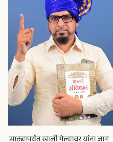
साठ्यापर्यंत खाली गेल्यावर यांना जाग आली आहे की, एसडीएमना पाणी चोरी थांबवण्याचे निवेदन द्यावे. आतापर्यंत काय सगळे कुंभकर्णासारखे झोपले होते का? असंच चालू राहिलं तर लवकरच शहरात लोक पाण्यासाठी तडफडताना दिसतील.

पदाधिकाऱ्यांवर थेट आरोप आहे. मग ज्या गरीब जनतेला पाणी विकत घेणे परवडत नाही, तिने काय करावे? एकतर गडहळू पाणी पिऊन आजारांना आमंत्रण द्यावे, नाहीतर आर.ओ.च पाणी विकत घेण्याची ताकद नसल्याने तहानलेली राहवी. नगर परिषदेच्या अधिकारी व पदाधिकाऱ्यांना माझी स्पष्ट मागणी आहे: जर तुम्ही जनतेला दर तिसऱ्या दिवशी आणि स्वच्छ, पिण्यायोग्य पाणी देऊ शकत नसाल, तर खुर्चीचा राजीनामा द्या आणि दुसरा धंदा बघा. कारण निवडणुकीपूर्वी सर्वच पदाधिकाऱ्यांनी वचन दिलं होतं की, "आम्ही जनतेला स्वच्छ आणि दररोज पाणी देऊ". काहींनी तर "शहर जार-मुक्त करू" अशी बढाई मारली होती. प्रत्यक्षात मात्र यांच्या कार्यकाळात शहरात सर्वात जास्त पाण्याचे खासगी प्लांट सुरू झाले आहेत. आज जुई धरणातील पाणीसाठी मृत