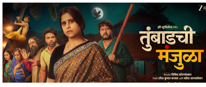
आणि विनोदनिर्मिती मनोरंजन करून जातो. मंजुळा नक्की कोण आहे या प्रश्नाच्या उत्तरासाठी हा चित्रपट नक्कीच कुटुंबासोबत थिएटर मध्ये पाहावा.