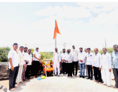
कार्यक्रमाच्या सुरुवातीला शिवरायांच्या