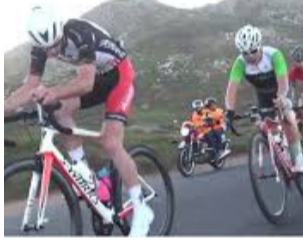
लोकनेतान्युज नेटवर्क लातूर फिरोज जागीरदार

सोनुर्ली, गाडेगाव, अंतरगाव, नारांडा, झोटिंग, सांगोडा, भारोसा परिसरातील तामसी व भैराम घाटांमध्ये मोठ्या प्रमाणात रेतीसाठी उपलब्ध असल्याने या घाटांवर अवैध उत्खनन करणाऱ्यांची नजर असल्याचे बोलले जात आहे. मागील काही आठवड्यांपासून या भागांतून दिवस-रात्र रेती व मुरुम उपसा होत असल्याचे नागरिकांचे म्हणणे आहे. चौकशी व कारवाईची मागणी स्थानिक नागरिकांनी या प्रकरणाची सखोल चौकशी करून दोषींवर कठोर कारवाई करण्याची मागणी प्रशासनाकडे केली आहे. अवैध उत्खननामुळे पर्यावरणाचा समतोल बिघडण्यासोबतच नदीपात्रांचे नुकसान होत असल्याची चिंता व्यक्त केली जात आहे. त्यामुळे महसूल विभाग, वनविभाग व पोलिस प्रशासनाने संयुक्त मोहीम राबवून सत्यस्थिती पडताळून आवश्यक ती कारवाई करावी, अशी मागणी होत आहे.