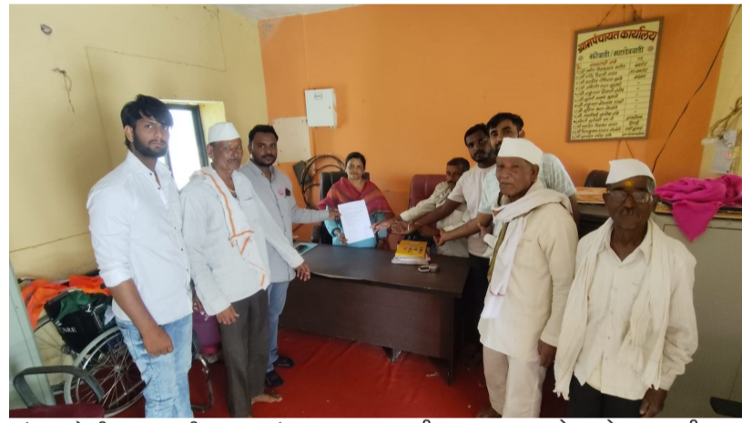
तुडुंब भरलेली असतानाही, गावकऱ्यांना पाणीटंचाईचा सामना करावा लागत आहे. तसेच गेल्या वर्षी नळाला होणाऱ्या

प्रतिनिधी: औसा तालुक्यातील भंगेवाडी गावात जलजीवन मिशन अंतर्गत पाणीपुरवठ्याचे कामे करण्यात आली. गेल्या तीन वर्षांपासून विहीर पाण्याने भरून असताना मात्र गावात ग्रामपंचायतच्या डिझाईन योजनेला मुळे ग्रामस्थांना पाणीटंचाईला सामोरे जावे लागत आहे. त्या विरोधात ग्रामस्थांनी दिनांक 24 जून रोजी धरणे आंदोलन करण्याचा इशारा ग्रामपंचायतीला दिलेला आहे. औसा तालुक्यातील भंगेवाडी ग्रामपंचायत ने गेल्या तीन वर्षांपासून जल जीवन मिशन अंतर्गत विहीर पाण्याची टाकी व घरोघरी नळ योजना राबविलेली आहे. मात्र कंत्राटदारांने विहीरीला विद्युत पुरवठा न केल्यामुळे विहीर