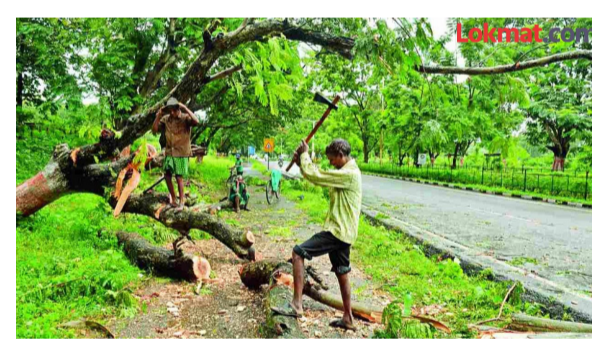
अधिकारी यांना या घडलेल्या आणि छायादार वृक्ष असलेल्या वटवृक्षाची तोडलेली सर्व विस्तारात्मक फांदी यामुळे निसर्गाचा मोठा न्हास होत आहे. आणि पौर्णिमेला मनोभावे पूजा करणाऱ्या महिलांच्या त्या भावनेचे

औसा: तालुक्यातील भादा ते औसा रोडवरील हळद दुर्ग शिवारामध्ये असणाऱ्या भादा ते औसा या मुख्य रोड लागत असलेल्या आणि अंदाज गेल्या आठ ते दहा वर्षांचे वय असलेल्या वटवृक्षाचे झाड हे आता येणाऱ्या वटपौर्णिमेच्या पूर्वीच कत्तल करण्यात आल्याने त्या झाडाच्या पूर्ण फांडा तोडून टाकल्या आहेत. यामुळे करुणा स्थापित मन असलेल्या अनेक नागरिकांना हे दृश्य पहावत नाही अशा प्रतिक्रिया त्या वृक्षाकडे पाहिल्यावर उमटत आहेत.परंतु या बाबीकडे संबधित गावातील जागरूक नागरिक आणि संबधित प्रशासकीय