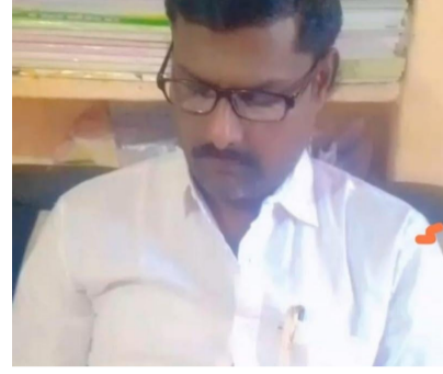
ग्रामविकास मंत्री जयकुमार गोरे यांची