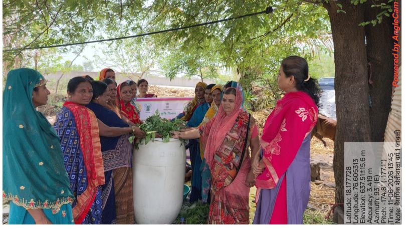
तालुका तंत्र व्यवस्थापक यांनी bbf, बीजप्रक्रिया,सोयाबीन वाणाची निवड या विषयी मार्गदर्शन केले.सहाय्यक