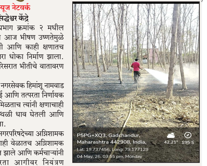
P5PG+XQ3, Gadchandur, Maharashtra 442908, India. Lat: 19.737456, Long: 79.177129. 04 May, 26, 03:55 pm, Monday