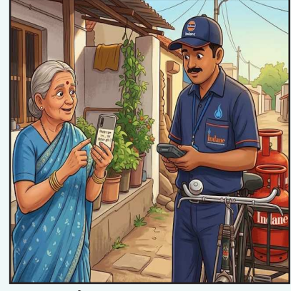
आली आहे. यामुळे आता मोठा प्रश्न उपस्थित होत आहे की, जर या प्रकाराशी एजन्सी मालकांचा कोणताही संबंध नसेल, तर डिलिव्हरी बॉयमध्ये अशा प्रकारे गरीब आणि अशिक्षित नागरिकांची

कोरपना-जिवती तालुक्यात गॅस वितरण व्यवस्थेतील भोंगळ कारभारामुळे सर्वसामान्य नागरिकांमध्ये तीव्र संतापाचे वातावरण निर्माण झाले आहे. विशेषतः आदिवासी, अशिक्षित, शेतकरी आणि मजूर कुटुंबांना लक्ष्य करून जड्ड च्या नावाखाली फसवणूक केली जात असल्याचे गंभीर आरोप समोर येत आहेत. मिळालेल्या माहितीनुसार, अनेक गावांमध्ये नागरिकांकडून नियमितपणे गॅस बुकिंग करून घेतले जाते. त्यानंतर ग्राहकांच्या मोबाईलवर आलेला जड्ड डिलिव्हरी बॉय स्वतः पाहून घेतो आणि थोड्या वेळात सिलेंडर मिळेल असे सांगतो. मात्र जड्ड घेतल्यानंतर अनेक गरीब कुटुंबांना सिलेंडरच मिळत नसल्याची धक्कादायक बाब समोर