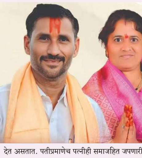
देत असतात. पतीप्रमाणेच पत्नीही समाजहित जपणारी खरे वैशिष्ट्य आहे. त्यामुळेच मुर्मा गावातील सर्वांच्या

यावे, स्वतःची ओळख निर्माण करावी आणि गावाच्या विकासात योगदान द्यावे, यासाठी त्या कायम प्रेरणा