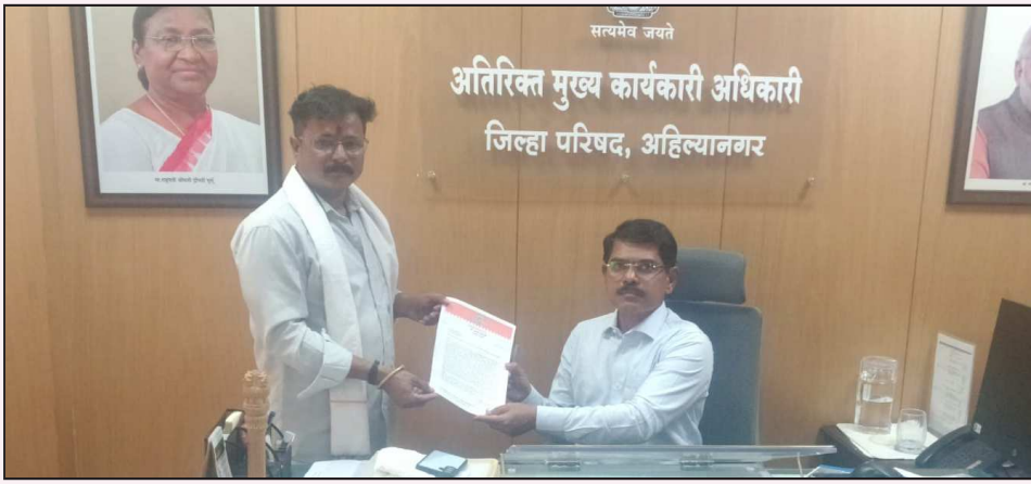
अतिरिक्त मुख्य कार्यकारी अधिकारी जिल्हा परिषद, अहिल्यानगर