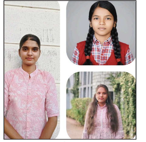
व्यक्त केली. विद्यार्थ्यांच्या या यशामुळे पालकांमध्ये समाधानाचे वातावरण पाहायला मिळत आहे. विद्यार्थ्यांच्या यशाबद्दल विद्यालयाचे शिक्षक,पालक आणि ग्रामस्थांकडून अभिनंदन होत आहे.

ग्रामीण भागातही दर्जेदार शिक्षण,शिस्तबद्ध वातावरण आणि शिक्षकांचे सातत्यपूर्ण मार्गदर्शन यामुळे हे यश शक्य झाल्याची भावना ग्रामस्थांनी