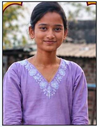
वारे (८८.६० टक्के)

महाराष्ट्र राज्य माध्यमिक व उच्च माध्यमिक शिक्षण मंडळ, पुणे यांच्यामार्फत घेण्यात आलेल्या सन २०२६ च्या माध्यमिक शालांत प्रमाणपत्र (SSC) परीक्षेत माध्यमिक विद्यालय मालेवाडी, ता. पाथर्डी, जि. अहिल्यानगर या विद्यालयाने शंभर टक्के निकालाची उच्च परंपरा कायम राखत उल्लेखनीय यश संपादन केले आहे. विद्यालयातील २६ पैकी २६ विद्यार्थी यशस्वीरित्या उत्तीर्ण झाले असून खरवंडी परिसरात मालेवाडी विद्यालयाने पुन्हा एकदा आपली शैक्षणिक गुणवत्ता सिद्ध केली आहे.