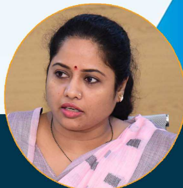
पंचमूर्तीताई धर्माधिकारी नगरअध्यक्ष परली वै.