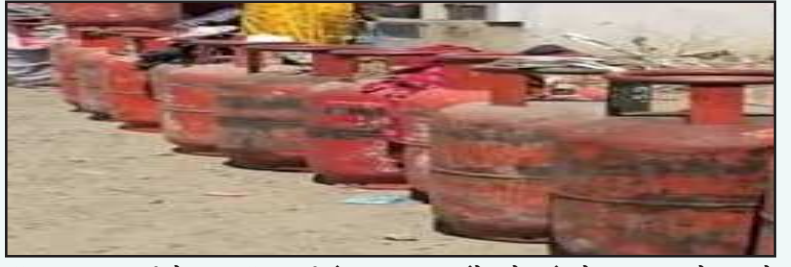
गॅस आणण्यासाठी गेल्यास गॅस साठी रांगच रांग दिसत आहेत. प्रशासन एका बाजूला गॅसची कमतरता नाही गॅस मोठ्या प्रमाणावर उपलब्ध असल्याचा दांगोरा करत आहे परंतु खरे वास्तव मात्र वेगळेच आहे. गॅस हा मिळत नसल्याने नागरिकांना रांगा लावाव्या लागत आहेत यानुसार गोरगरीब सर्वसामान्य नागरिक रोजंदारीने त्यांना कामाला जावे लागते परंतु गॅस आणण्यासाठी गेल्याने दोन ते तीन तास रांगेमध्ये थांबावे लागत आहे यामुळे त्यांच्या रोजगार बुडत असून यामुळे जनजीवन पूर्णतः विस्कळीत झाले आहे याबाबत प्रशासनाने जागरूकता दाखवत घरपोच गॅस कसा मिळेल या सुविधेकडे लक्ष द्यायला हवे, धारूर तहसील पुरवठा विभाग मात्र मूग गिळून गप असल्याचे दिसून येत आहे यावर प्रशासनाने तोडगा काढणे गरजेचे आहे

धारूर शहरात भर उन्हात गॅस मिळण्यासाठी रांगा लागल्याचे दिसून येत आहे. यामुळे सर्वसामान्यांना गॅस मिळवण्यासाठी रांगेत थांबावे लागत आहे सर्व कामे सोडून या रांगेत थांबावे लागत आहे. यातून सर्वसामान्यांचे जीवन विस्कळीत झाले आहे.