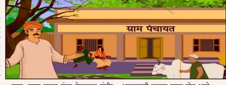
स्वतः तयार करून मंजूर केल्याचा गंभीर आरोप समोर आला आहे. असल्याची भावना व्यक्त होत आहे. दरम्यान, सदस्यांनी प्रश्न उपस्थित केल्यास त्यांच्याशी उद्दट व अपमानास्पद वर्तन केले जात असल्याचा तक्रारी पुढे आल्या आहेत. विशेषतः महिला सदस्यांचा अपमान झाल्याच्या घटनांमुळे गावात संतापाचे वातावरण निर्माण झाले आहे. तसेच सरपंच बैठकीस अनुपस्थित राहत असल्याची

जिवती तालुक्यातील दमपूर मोहदा ग्रामपंचायतीचा कारभार सध्या गंभीर वादाच्या भोवऱ्यात सापडला असून, सरपंच व ग्रामसेवक यांच्या कार्यपद्धतीवर ग्रामस्थांनी तीव्र नाराजी व्यक्त केली आहे. विविध अनियमितता, गैरव्यवहार आणि मनमानी कारभारामुळे संपूर्ण ग्रामपंचायत प्रशासनावर संशय निर्माण झाला आहे. मिळालेल्या माहितीनुसार, गावात ग्रामसभा नियमित घेतली जात नसून नागरिकांचा सहभाग पूर्णपणे डावलला जात आहे. ग्रामसभेशिवायच अनेक महत्त्वाचे निर्णय घेतले जात असल्याने गावाच्या विकास प्रक्रियेला धक्का बसत आहे. विशेष म्हणजे, वार्षिक विकास आराखडाही ग्रामसेवकांनी