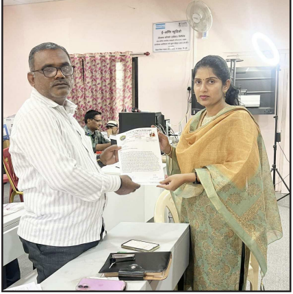
करून दोषींवर कडक कारवाई करावी, तसेच पारदर्शक पद्धतीने प्रवेश प्रक्रिया राबवावी, अशी मागणी निवेदनातून करण्यात आली आहे. दरम्यान, या विषयावर लवकरात लवकर कारवाई न झाल्यास आंदोलनाचा इशारा देखील तेजस्वी फाउंडेशनच्या वतीने देण्यात आला आहे.