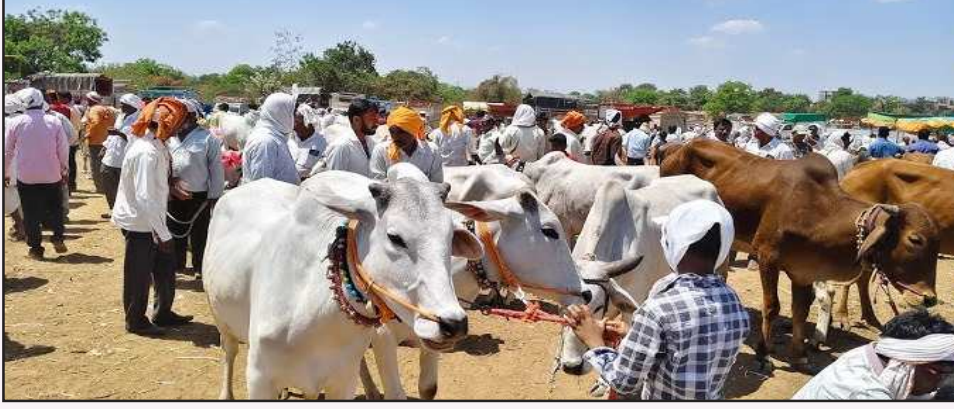
शेतकरी येथे बैल खरेदी व विक्रीसाठी येताना दिसून येत आहेत. यामुळे बैलांची मागणी अचानक वाढली

शेतीत यांत्रिकीकरण वाढल्यामुळे काही काळ बैलांचे महत्त्व कमी झाले होते. अनेक शेतकरी ट्रॅक्टरच्या सहाय्याने शेतीची मशागत करू लागले होते. मात्र सध्या ट्रॅक्टरचे वाढते भाडे आणि इंधन खर्च परवडेनासा झाल्याने शेतकरी पुन्हा पारंपरिक शेतीकडे वळताना दिसत आहेत. त्यामुळे बैलांची मागणी अचानक वाढली असून देगलूर येथील आठवडी बाजारात बैलांच्या किमतीत मोठी वाढ झाल्याचे चित्र आहे.