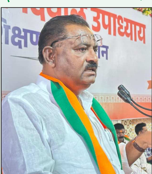
महाराष्ट्रातील राजकारणावर भाष्य करताना त्यांनी सांगितले की, मुख्यमंत्री देवेंद्र फडणवीस यांच्या

पंतप्रधान नरेंद्र मोदी असून त्यांनी देशाला स्थैर्य, विकास आणि सुरक्षिततेची नवी दिशा दिली आहे. ते पुढे म्हणाले की, भारतीय जनता पार्टीच्या विचारांची पायाभरणी करताना अनेक पिढ्यांनी त्याग केला. अटल बिहारी वाजपेयी, लाल कृष्ण अडवाणी, मुसली मनोहर जोशी, यांसारख्या ज्येष्ठ नेत्यांनी पक्षाची विचारधारा देशभर पोहोचवली. आज त्याच विचारांच्या बळावर पक्ष देशातील सर्वांत मोठा राजकीय पक्ष बनला आहे. पंतप्रधान नरेंद्र मोदी यांच्या नेतृत्वाखाली देशाने जागतिक स्तरावर आपले स्थान अधिक बळकट केले आहे. आंतरराष्ट्रीय पातळीवर भारताची प्रतिमा उंचावली असून अनेक देश भारताकडे आदाराने पाहत आहेत. गरीब, वंचित, शोषित, दलित व आदिवासी घटकांना मुख्य प्रवाहात आणण्यासाठी विविध योजना राबवण्यात आल्या आहेत. घरकूल, आरोग्यसेवा, पायाभूत सुविधा, डिजिटल सेवा या क्षेत्रांत मोठ्या प्रमाणावर प्रगती झाली असून सामान्य नागरिकांच्या जीवनमानात सकारात्मक बदल घडत आहेत, असेही त्यांनी स्पष्ट केले.